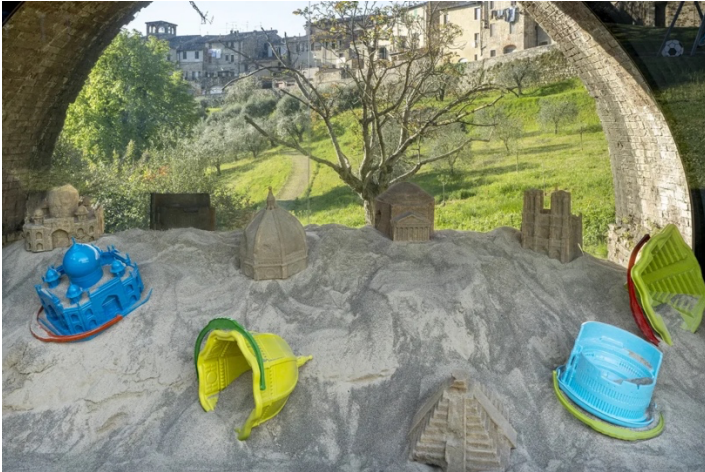
immagine per Leandro Erlich, Sotto Gli Archi del Tempo

Proprio tale fragilità, precarietà di questo suo visionario, allusivo paesaggio, mostra quanto il patrimonio riveli “la sua natura più profonda: non pietra eterna, ma una materia delicata — come la sabbia — tenuta insieme dalla responsabilità di chi se ne prende cura” . O dovrebbe. La sabbia, quindi, contrassegno dell’inventiva infantile e di ricreazione collettiva, memento e convocazione della nozione di bellezza caduca, così predisposta e formalizzata ci fa riflettere non solo sulla vulnerabilità e la fragilità dell’esistenza e a maggior ragione delle cose, quindi anche sulla natura del nostro patrimonio, ma anche sulla responsabilità collettiva e sulla vanità e presunzione (umana) della permanenza che è afferente a quella responsabilità poc’anzi indicata.