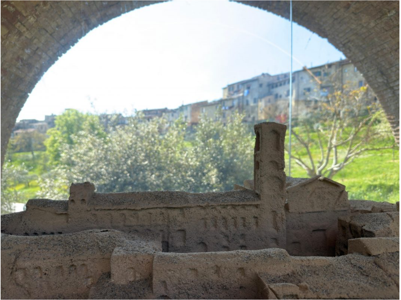
Leandro Erlich, Sotto gli Archi del Tempo, dettaglio dell'opera in allestimento

Ci sono interventi che trasformano temporaneamente lo spazio urbano, invitando il pubblico a guardare con occhi diversi luoghi abituali. È il caso di Sotto gli Archi del Tempo , il nuovo progetto di Leandro Erlich , tra i protagonisti più noti della scena artistica internazionale, che arriva a Colle di Val d'Elsa con una serie di installazioni di sabbia pensate appositamente per l' UMoCA – Under Museum of Contemporary Art , spazio museale ideato da Cai Guo-Qiang .