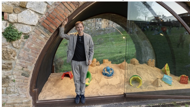
Leandro Erlich, Sotto Gli Archi del Tempo ©ELA BIALKOWSKA OKNO studio. Courtesy Associazione Arte Continua

Può la sabbia, addestrata a dovere dall'artista Leandro Erlich , costruire mondi a immagine e somiglianza realistica (in scala ridotta), comunicando, seppure in maniera apparentemente leggera e ironica, quanto il tempo la faccia da padrone in ogni nostro progettare e concretizzare e quanto la nostra esistenza sia caduca, e ogni nostro edificare e agire destinato al mutevole, al transitorio (dimenticando solo per un attimo quanto di durevole c'è nella distruzione connessa a questi nostri tempi oscuri).