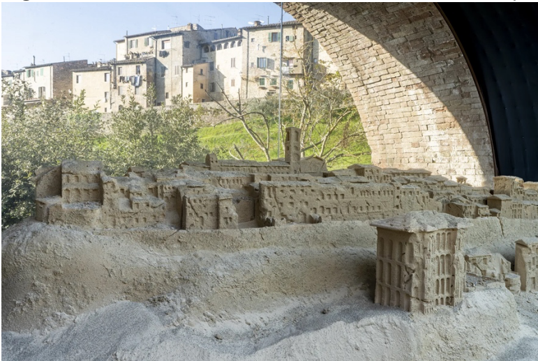
Leandro Erlich, Sotto Gli Archi del Tempo

Nel secondo arco , l'arena assume la forma di una cartografia del borgo di Colle Val d'Elsa in scala ridotta, scolpito “come se fosse stato modellato dal vento” , ci dettaglia l'artista, con la città che si fa “rilievo effimero che ricorda la natura transitoria di ogni insediamento umano” inevitabilmente portando a galla connessioni con la geopolitica internazionale che questi nostri tempi oscuri, di guerre, prevaricazioni, genocidi, distruzioni, nuove predazioni, afferiscono proprio a mai sanate questioni di territorialità, risorse, confini, organizzazioni urbane, sociali, di comunità e alla loro precarietà.