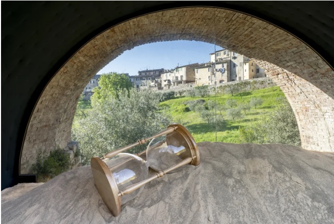
Leandro Erlich, Sotto Gli Archi del Tempo

Nel secondo arco , l'arena assume la forma di una cartografia del borgo di Colle Val d'Elsa in scala ridotta, scolpito “come se fosse stato modellato dal vento” , ci dettaglia l'artista, con la città che si fa “rilievo effimero che ricorda la natura transitoria di ogni insediamento umano” inevitabilmente portando a galla connessioni con la geopolitica internazionale che questi nostri tempi oscuri, di guerre, prevaricazioni, genocidi, distruzioni, nuove predazioni, afferiscono proprio a mai sanate questioni di territorialità, risorse, confini, organizzazioni urbane, sociali, di comunità e alla loro precarietà.