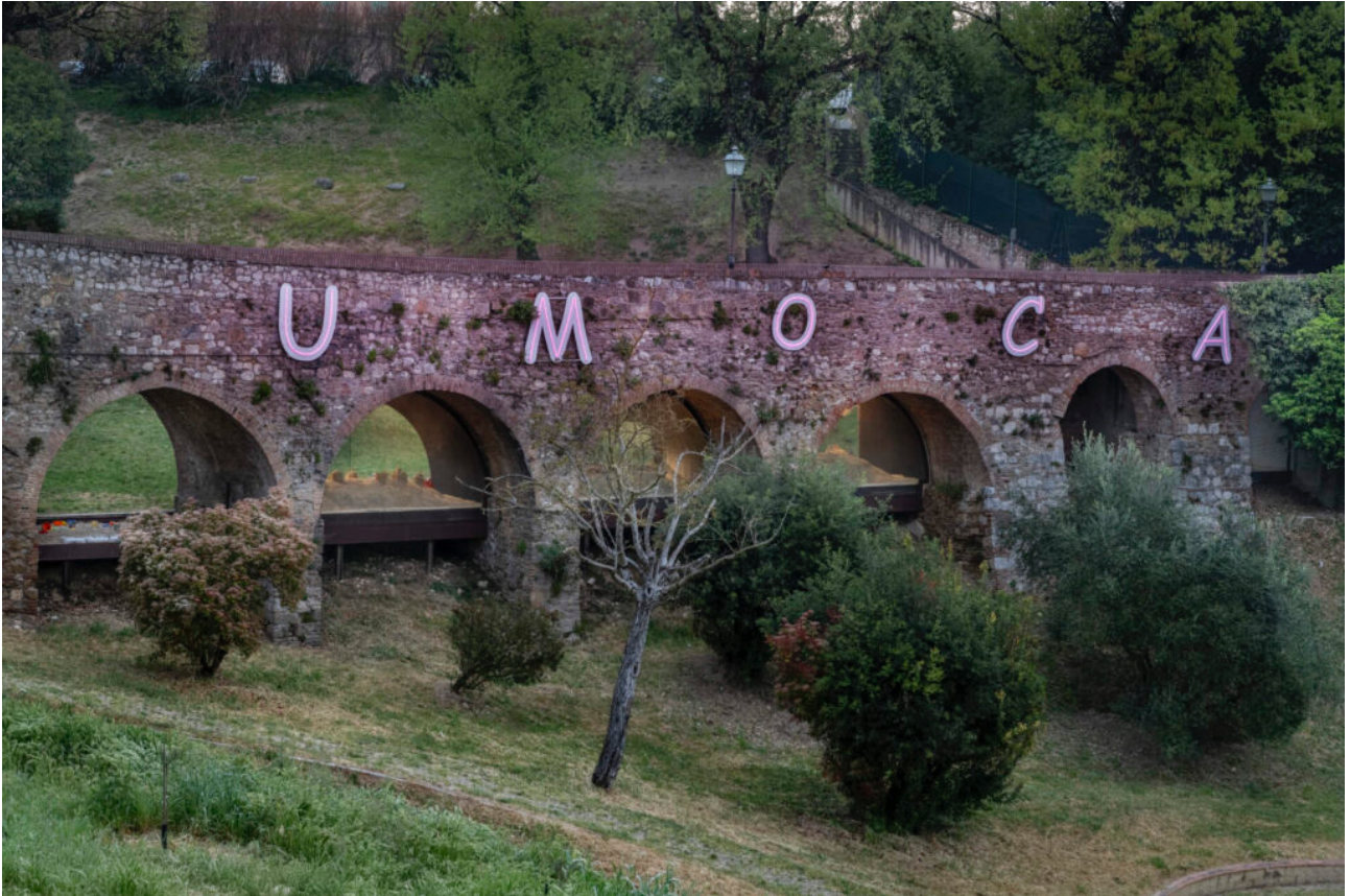
Leandro Erlich, Sotto Gli Archi del Tempo