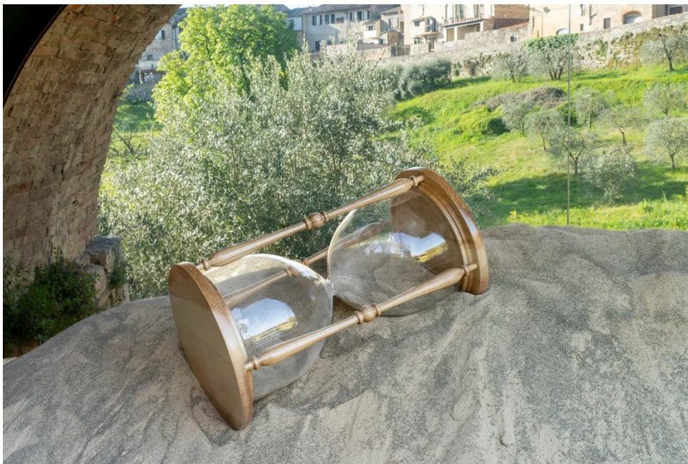
'Sotto gli Archi del Tempo' di Leandro Erlich a a Colle di Val d'Elsa